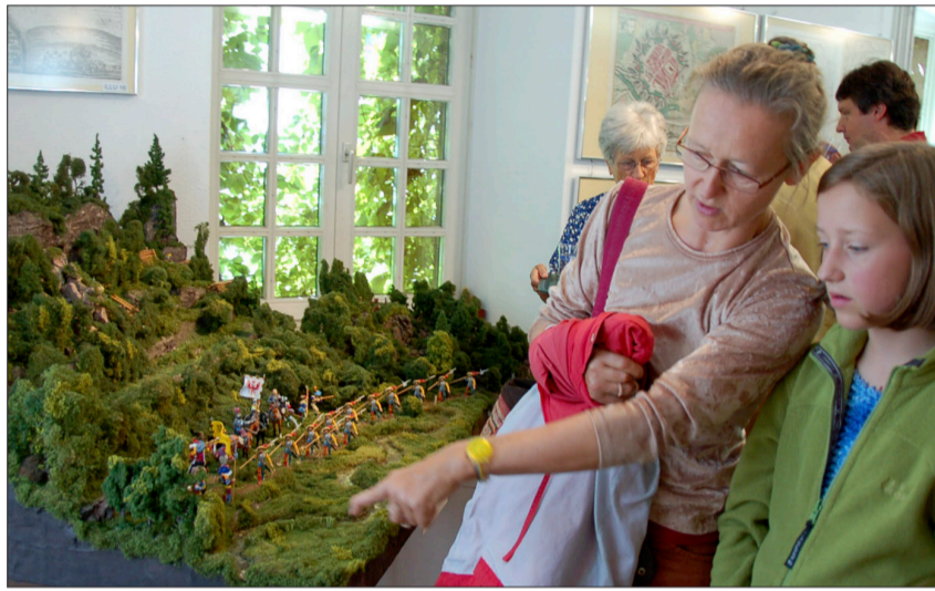
Hingucker der Ausstellung sind insbesondere die Modelle, die anschaulich Aufbau und Funktion der Verteidigungselemente zeigen. Das zeigte sich gestern an der gut besuchten Vernissage.