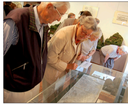
Auch seltene Stiche, Pläne und Funde gehören zur Ausstellung.