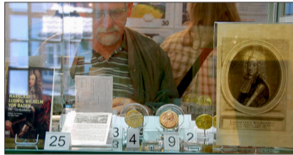
Er ist in der Ausstellung stets im Blick: Markgraf Ludwig Wilhelm.

rock-Schanze und Einrichtung eines Waldglas-Zentrums in Gersbach) in direktem Zusammenhang mit der Ausstellung zu sehen seien. Überhaupt habe Gersbach den Forschungen der Minifossis viel zu verdanken. Die Kooperation Gersbachs mit der Gruppe der Friedrich-Ebert-Schule sei „eine Erfolgsgeschichte“, so Ühlin.